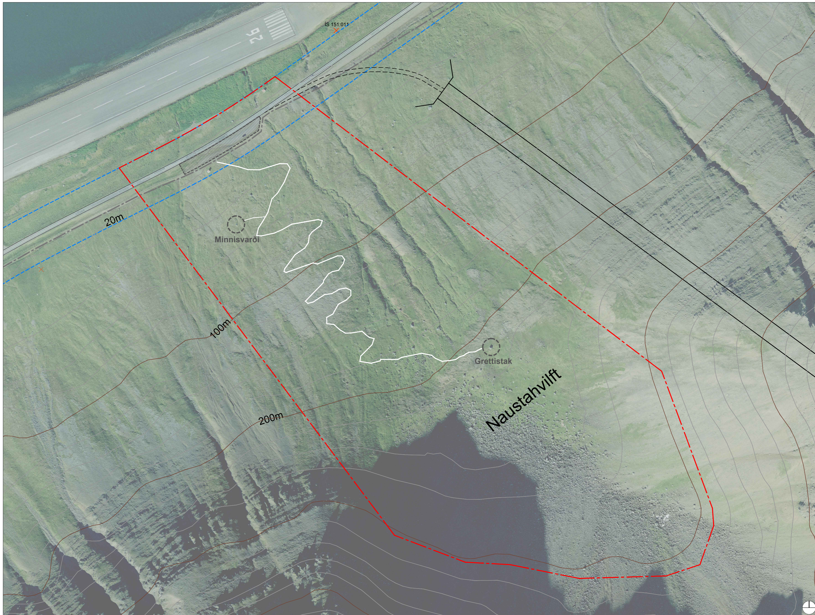
Tillaga að deiliskipulagi: Naustahvilft, útivistarsvæði og gönguleið í mkv. 1:2500